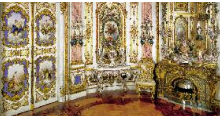
Porzellankabinett Ludwigs II. im Kleinen Appartement nach Vorbildern des Rokoko, Manufaktur Meißen, 1884–1886

und Qualität der Porzellanausstattung ist ohne jeden Vergleich. Auch die Textilien sind von herausragender Qualität und einzigartiger Pracht. Ein Ideal in der Kunst des 19. Jahrhunderts, das »Vollenden« historischer Stile, hat in diesem Gebäude seine großartigste Ausprägung erfahren. Der von Carl von Effner nach Versailler Vorbild entworfene Park sollte einen Großteil der Insel umgreifen. Bis zum Tod Ludwigs II. 1886 war nur die Mittelachse mit ihren grandiosen Wasserspielen fertiggestellt. Auch das Schloss blieb ein Torso.