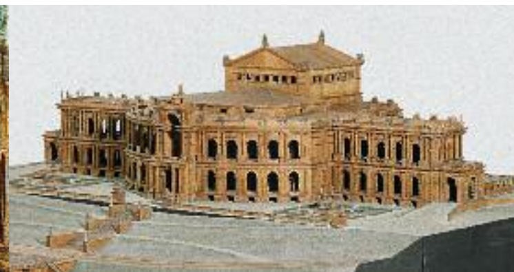
Modell für ein Richard-Wagner-Festspieltheater auf dem Isarhochufer in München, geplant 1864–1866, Ludwig II.-Museum

Bühnenbildmodelle ausgestellt. Die »Königsschlösser« Neuschwanstein, Linderhof und Herrenchiemsee sind ebenso dokumentiert wie die anderen Bauprojekte Ludwigs II. Originale Prunkmöbel aus dem zerstörten königlichen Appartement der Münchener Residenz oder aus dem ersten Schlafzimmer von Schloss Linderhof sind Höhepunkte des Museums. Schau- und Prunkstücke des Kunsthandwerks, vom König in Auftrag gegeben, dokumentieren den europäischen Rang der Münchener Kunst in der zweiten Hälfte des 19. Jahrhunderts.