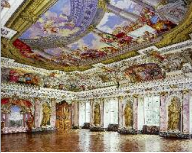
Barocker Kaisersaal mit illusionistischen Wand- und Deckenmalereien (oben); Detail eines Türflügels im Kaisersaal (unten)