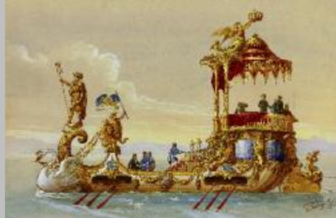
Entwurf einer Prunkbarke für König Ludwig II., Ludwig II.-Museum (oben); König Ludwig II. in einem Armlehnstuhl sitzend, kolorierte Photographie (unten)