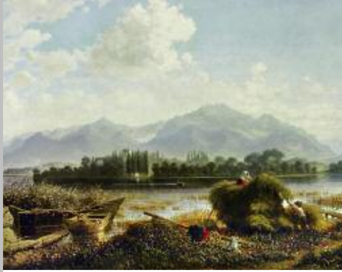
Blick auf Herrenchiemsee von der alten Überfahrtstelle Urfahrn aus, die auch Ludwig II. benützte. Gemälde des »Chiemseemalers« Albin Mattenheimer, 1874