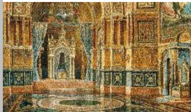
Entwurf für das Schlafzimmer der geplanten Burg Falkenstein, Max Schultze, 1885, Ludwig II.-Museum

Das Museum ist in zwölf modern gestalteten Räumen im Erdgeschoss des Südflügels untergebracht und wurde 1987 eröffnet. Es widmet sich den Lebensstationen Ludwigs II. von der Geburt bis zum frühen tragischen Tod anhand von gemalten Porträts, Büsten, historischen Photographien und originalen Prunkgewändern. Als Mäzen des Komponisten Richard Wagner ging der König in die Musikgeschichte ein. Zu diesem Thema sind Porträts, schriftliche Dokumente sowie Theater- und