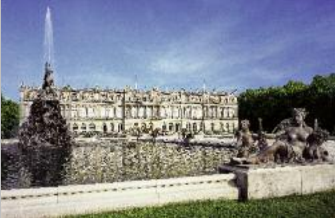
Nördliches Bassin mit dem Fama-Brunnen und der Gartenfassade des Königsschlusses (oben); Prunkvase mit Reliefbüste König Ludwigs XIV. von Frankreich (unten)