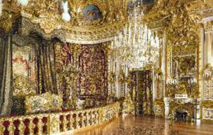
Das Paradeschlafzimmer im Großen Appartement, im Stil Ludwigs XIV. von Frankreich, ist der teuerste Raum des 19. Jahrhunderts. Es wurde 1879–1881 geschaffen.

und Qualität der Porzellanausstattung ist ohne jeden Vergleich. Auch die Textilien sind von herausragender Qualität und einzigartiger Pracht. Ein Ideal in der Kunst des 19. Jahrhunderts, das »Vollenden« historischer Stile, hat in diesem Gebäude seine großartigste Ausprägung erfahren. Der von Carl von Effner nach Versailler Vorbild entworfene Park sollte einen Großteil der Insel umgreifen. Bis zum Tod Ludwigs II. 1886 war nur die Mittelachse mit ihren grandiosen Wasserspielen fertiggestellt. Auch das Schloss blieb ein Torso.