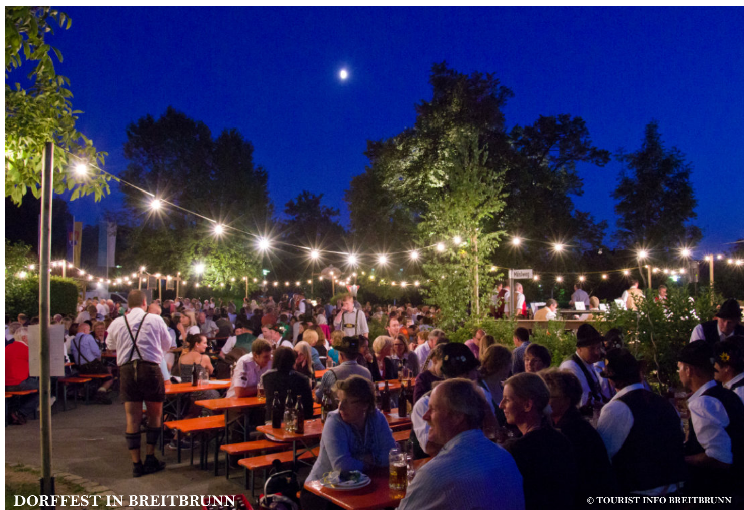
DORFFEST IN BREITBRUNN