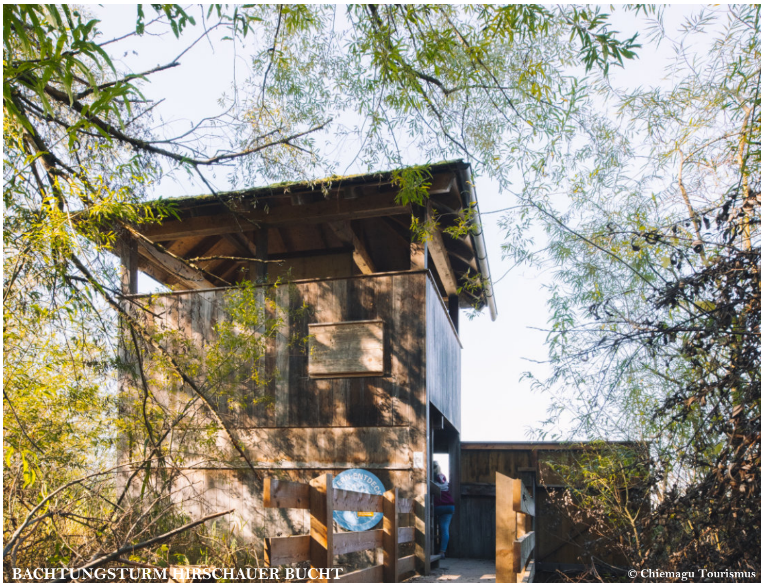
BACHTUNGSTURM HIRSCHAUER BUCHT